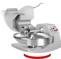
Finition parfaite angle arrondi