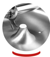
Bouchon pour vidange de la cuve

* Titane 45 variateur sur moteur couteaux.