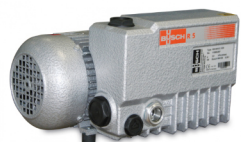
POMPE BUSCH EN OPTION