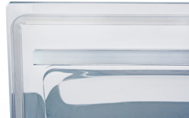
Detail du couvercle