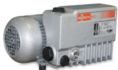
POMPE BUSCH EN OPTION