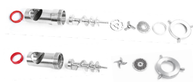
Double coupe Système Unger