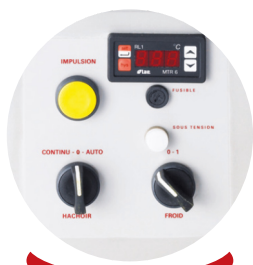
Tableau de commande