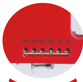
Calibreur automatique de 90 à 190 grammes