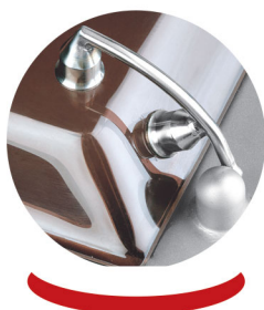
Charnières robustes assurant un bon maintien en évitant la casse du couvercle