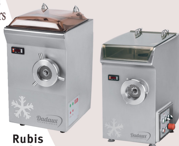
Rubis Corps fixe